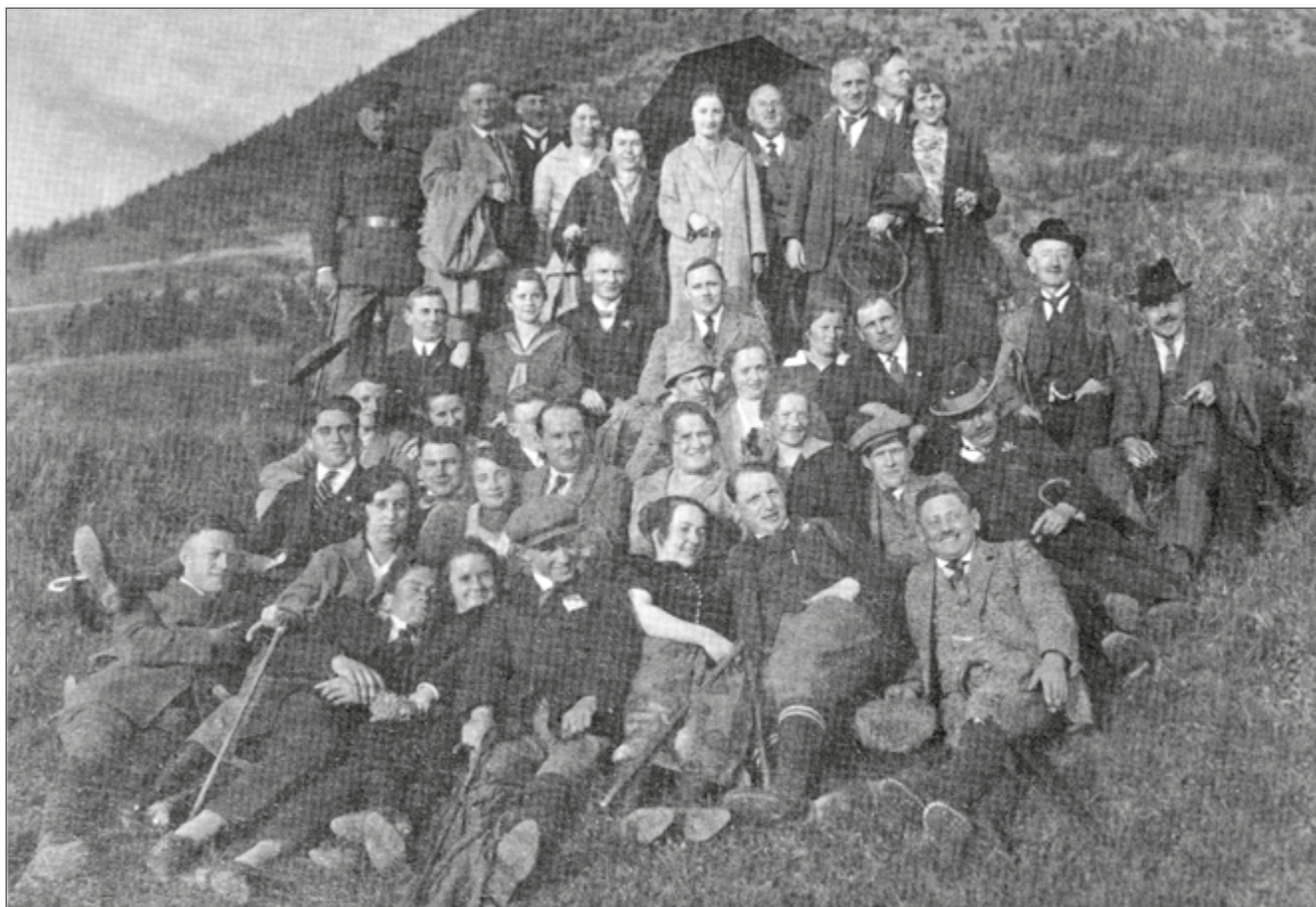
Oben: Schwäbischer Albverein Waldstetten um 1925. Unten: Turnerinnen aus Waldstetten beim Turnfest in Stuttgart 1933.